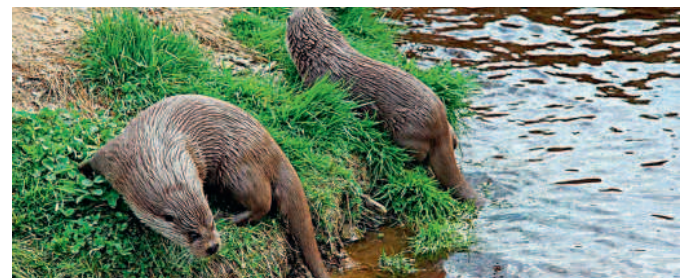
Wer Glück hat, kann die Otter beim Teich in voller Pracht entdecken

viertler Wasserwelt erkunden. Nach der Entdeckungsreise kann man sich außerdem im Café des UnterwasserReichs mit Kaffee, süßen Mehlspeisen und regionalen Schmankerln stärken. Wer die Köstlichkeiten nach Hause nehmen möchte, hat im Shop die Möglichkeit, heimische Produkte aus dem Waldviertel zu kaufen. Mehr Infos zu den Preisen sowie der Unterwasserwelt finden Sie unter www.unterwasserreich.at