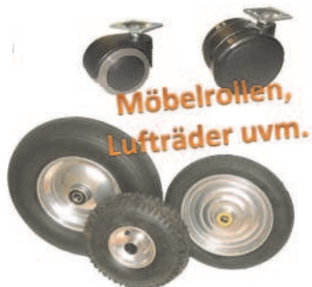
Möbelrollen, Lufträder uvm.