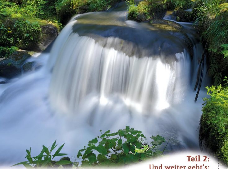
Teil 2: Und weiter geht's: